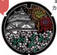
① 岡崎城に桜と花火

設置開始／1987年(カラー2016年) 市政 70 周年を記念して 1987 年に製作した岡崎市初のデザイン蓋です。さくら名所 100 選に選ばれた岡崎城の桜と伝統の三河花火が描かれています。2016 年にカラー化し、家康公の幼名にちなんだ“竹千代通り”(乙川の堤防道路)に設置しています。